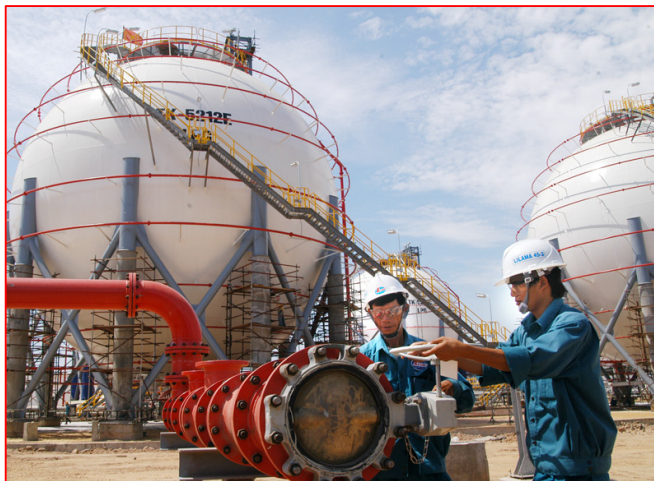
Thi công lắp đặt đường ống dẫn dầu và bồn chứa

+ Tiếp tục duy trì, ổn định và phát triển các lĩnh vực sản xuất các sản phẩm như trong thời gian qua. Trong đó, tập trung nâng cao năng lực sản xuất thiết bị cơ khí thủy công, thủy lực cho các dự án thủy điện. Đồng thời, tiến đến thiết kế, chế tạo, lắp đặt các thiết bị cơ khí, thiết bị điện cho các nhà máy nhiệt điện, phong điện.