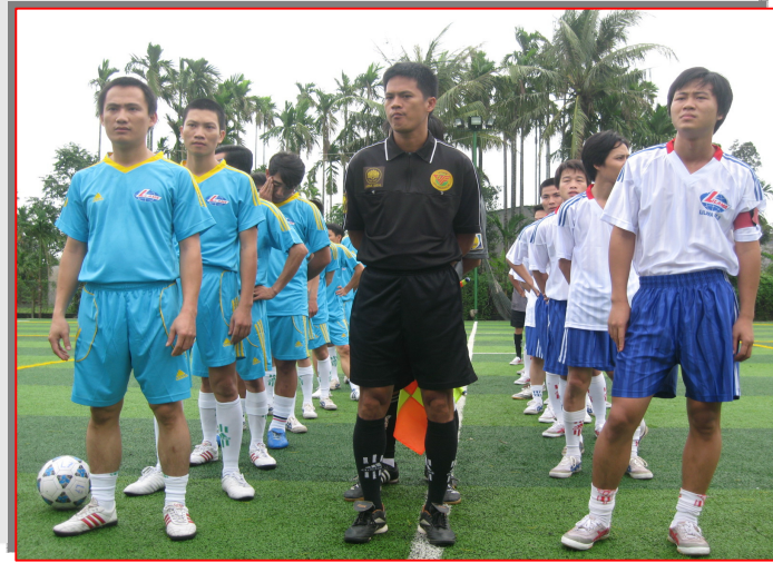
Giao lưu thể thao với đơn vị bạn

+ Đẩy mạnh phong trào văn hoá, văn nghệ thể thao quần chúng tạo ra cuộc sống tinh thần sôi động, xoá bỏ các tệ nạn xã hội, tích cực tham gia các phong trào với địa phương có hiệu quả.