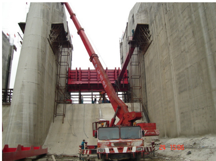
Gia công, Lắp đặt thiết bị cơ khí thủy công nhà máy thủy điện

Hiện nay Công ty đang triển khai thi công tháo dỡ, vận chuyển nhà máy Đường Quế Sơn về nhà máy đường KCP Sơn Hòa, lắp đặt và vận hành máy móc thiết bị lò hơi nhà máy đường KCP Sơn Hoà; lắp đặt thiết bị cơ khí thủy công nhà máy thủy điện Hà Nang; lắp đặt thiết bị cơ điện nhà máy thủy điện: Srêpok 3, Srêpok 4, Iarung & Chur