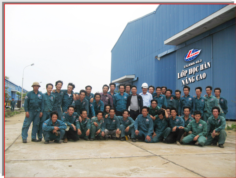
Lớp học hàn nâng cao Cty CP Lilama 45.3