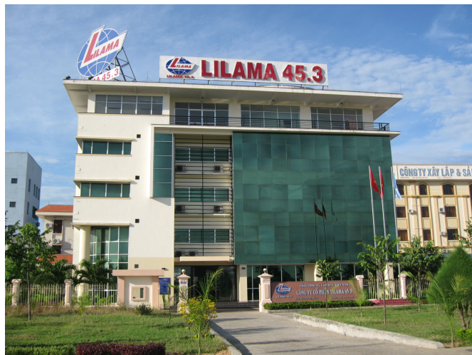
Trụ sở chính C ty CP Lilama 45.3 tại Quảng Ngãi