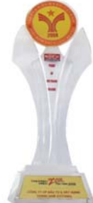
DANH HIỆU “THƯƠNG HIỆU MẠNH VIỆT NAM” năm 2005, 2006, 2007, 2008