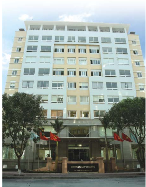
Trụ sở chính của COTANAGROUP

Công ty được chuyển đổi thành Công ty Cổ phần Đầu tư và Xây dựng Thành Nam, chính thức đi vào hoạt động theo Giấy chứng nhận đăng ký kinh doanh số 0103003621 ngày 04/02/2004 (đăng ký lần đầu). Ngày 29/07/2010 thay đổi lần thứ 9 theo Giấy chứng nhận đăng ký kinh doanh với mã số doanh nghiệp: 0101482984 do Sở Kế hoạch và Đầu tư thành phố Hà Nội cấp với số vốn điều lệ là 50.000.000.000 đồng.