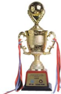
CÚP VÀNG Giải bóng đá truyền thống