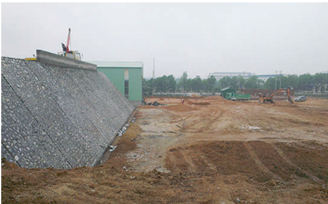
Toàn cảnh nhà máy