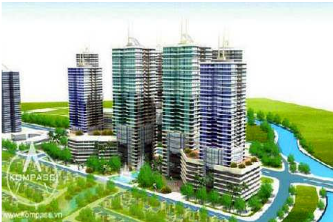
Dự án Khu đô thị mới An Hưng - Hà Đông - Hà Nội