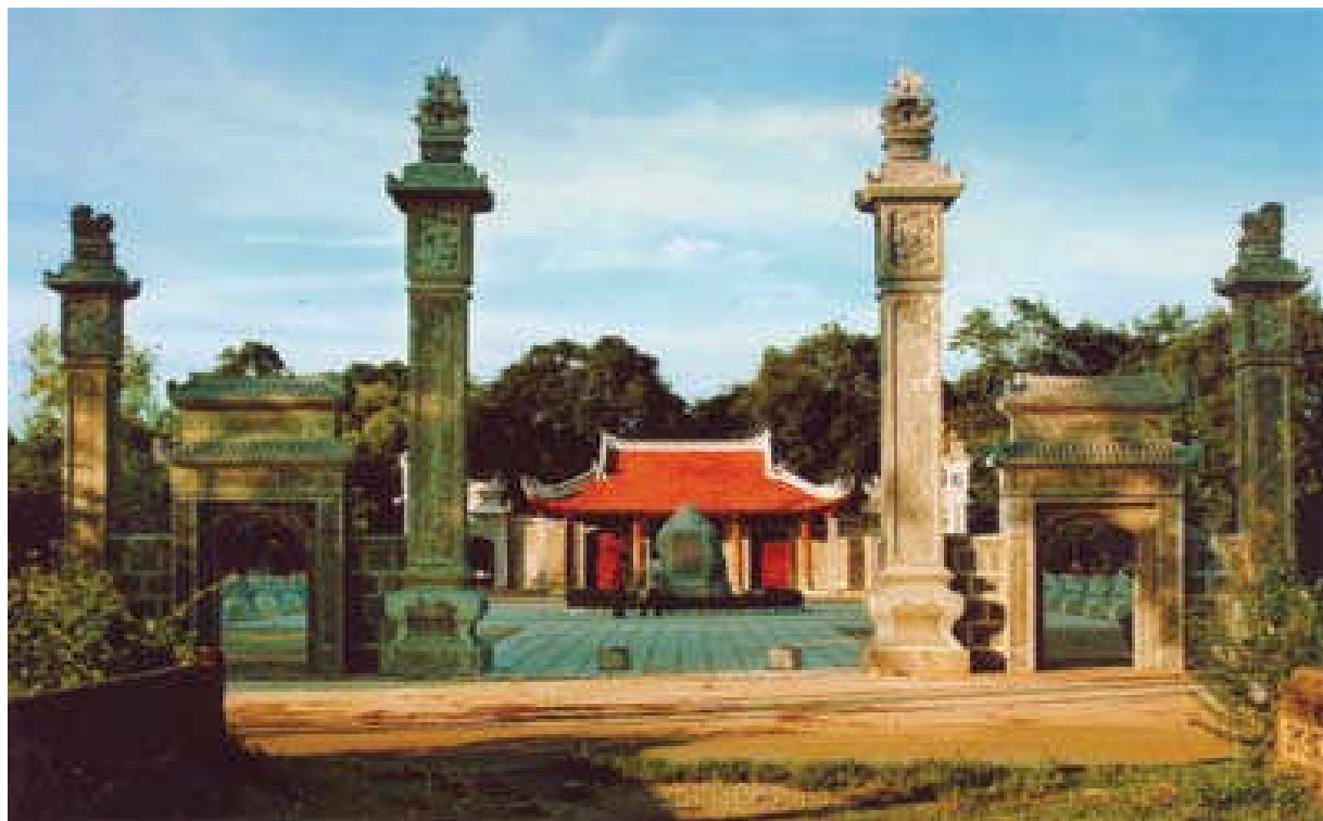
Dự án Đền thờ Hai Bà Trưng – Mê Linh, Hà Nội