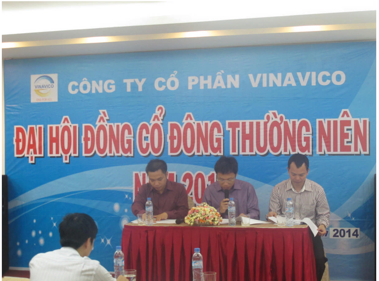
Họp Đại hội đồng cổ đông thường niên năm 2014

có giá trị từ 50% tổng giá trị tài sản trở lên; quyết định mức chi trả cổ tức, phát hành cổ phiếu và trái phiếu; bổ nhiệm và bãi miễn các thành viên Hội đồng quản trị