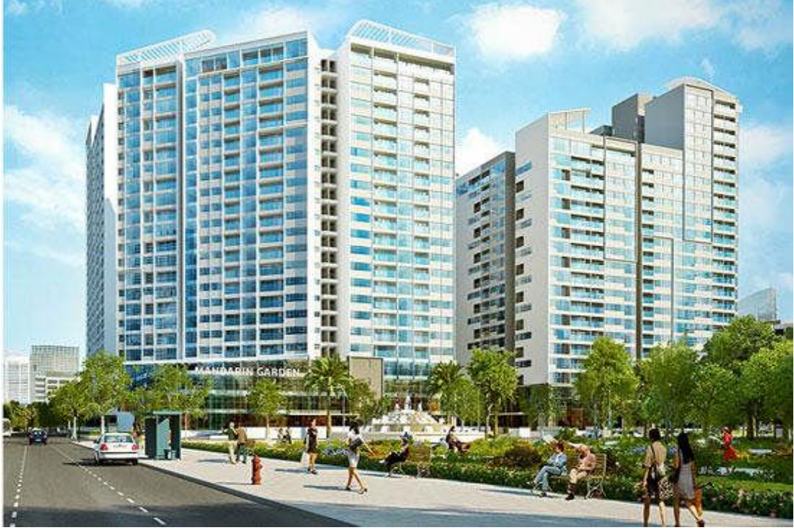
Dự án Mandarin Garden