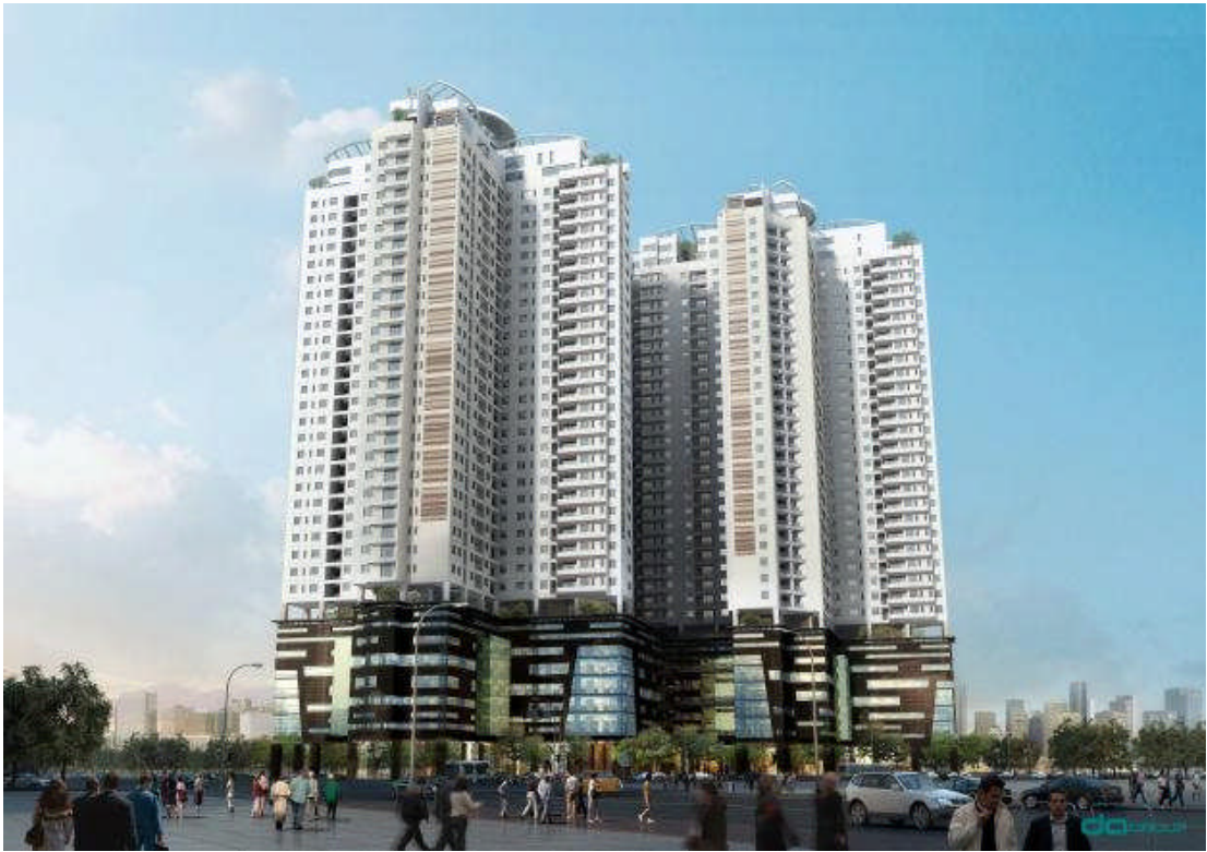
Dự án Golden Pacale