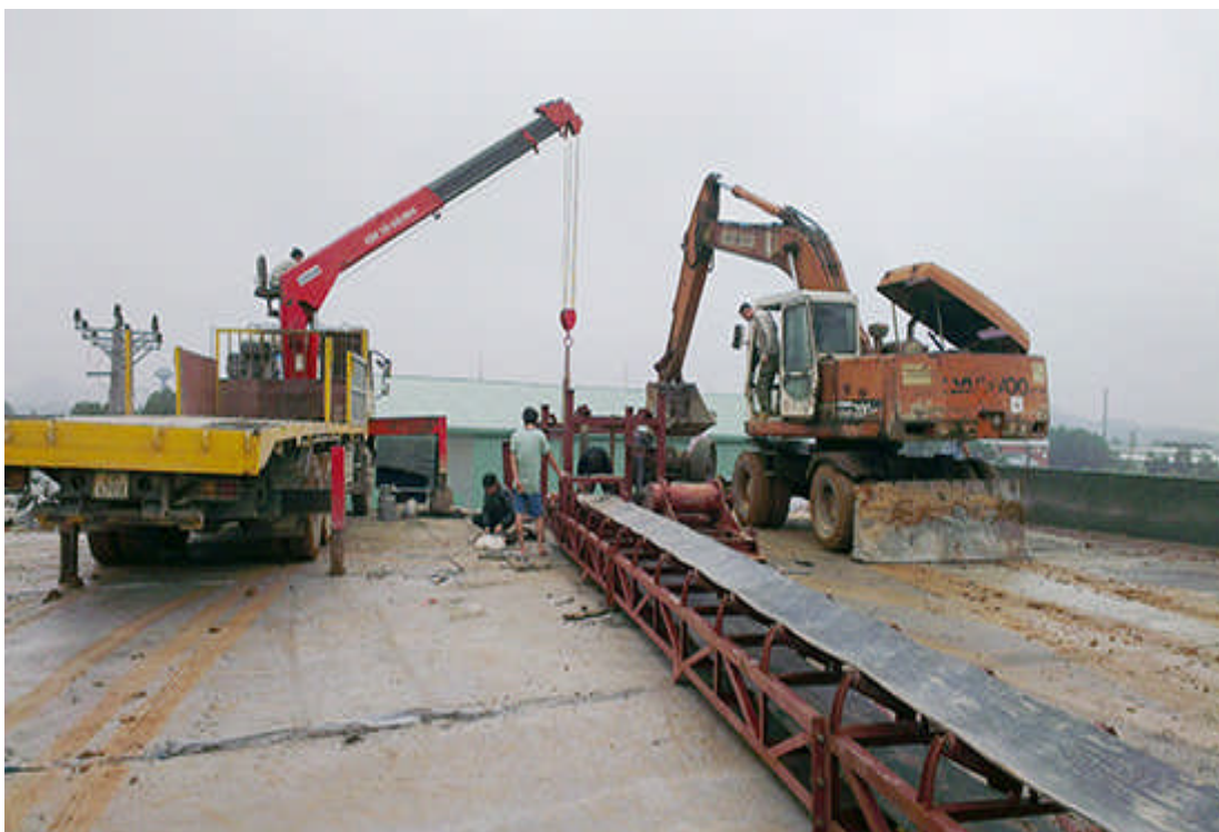
Lắp đặt băng tải chuyển nguyên liệu