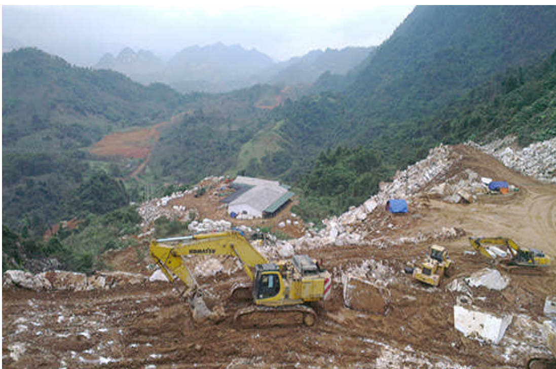
Khai thác nguyên liệu từ mỏ của công ty