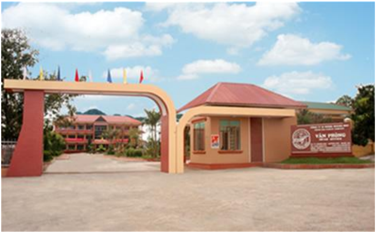
Trụ sở Công ty Cổ phần Xi măng Vicem Hoàng Mai