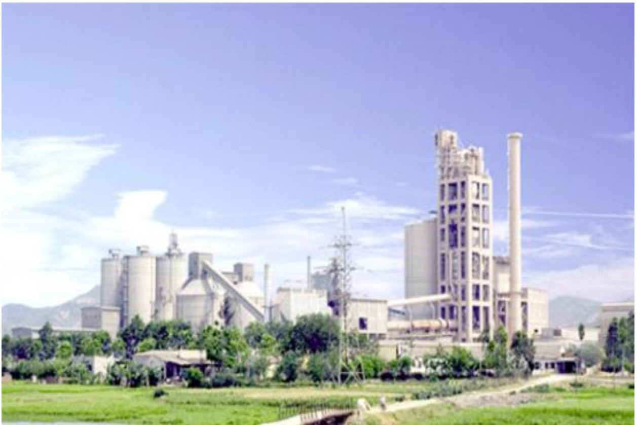
Toàn cảnh nhà máy Xi măng Vicem Hoàng Mai