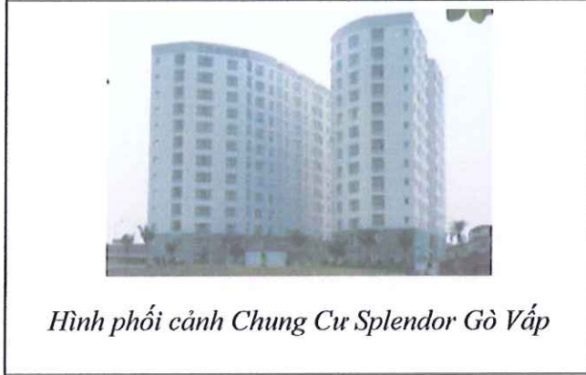
Hình phối cảnh Chung Cư Splendor Gò Vấp

Khu căn hộ tọa lạc tại mặt tiền đường Nguyễn Văn Dung, giáp mặt tiền sông Bến Cát. Đây là điểm kết nối giao thông thuận lợi đến trung tâm các quận, sân bay quốc tế Tân Sơn Nhất, khu công viên Phần mềm Quang Trung, gần với hệ thống đường giao thông Xuyên Á đi các tỉnh Bình Dương, Đồng Nai và các tỉnh miền Tây.