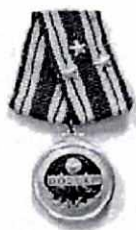
Huân chương Độc lập Hàng Nhất