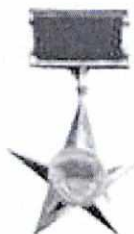
Anh hùng LLVT Nhân dân