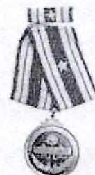
Huân chương Độc lập Hàng Ba