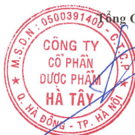
Lê Xuân Thắng

(Các thuyết minh từ trang 10 đến trang 36 là bộ phận hợp thành của Báo cáo tài chính này)