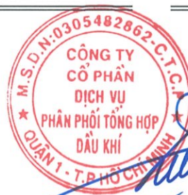
Vũ Tiến Dương Chủ tịch HĐQT Ngày 30 tháng 03 năm 2018

Các thuyết minh từ trang 9 đến trang 33 là một phần cấu thành báo cáo tài chính riêng này.