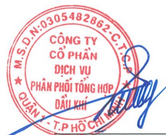
Vũ Tiến Dương Chủ tịch HĐQT Ngày 30 tháng 03 năm 2018

Các thuyết minh từ trang 9 đến trang 33 là một phần cấu thành báo cáo tài chính riêng này.