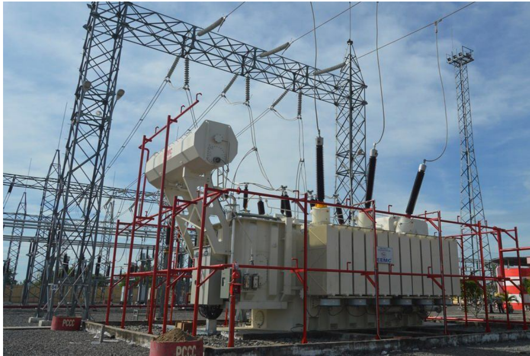
Sản phẩm Máy biến áp 220kV của Tổng Công ty