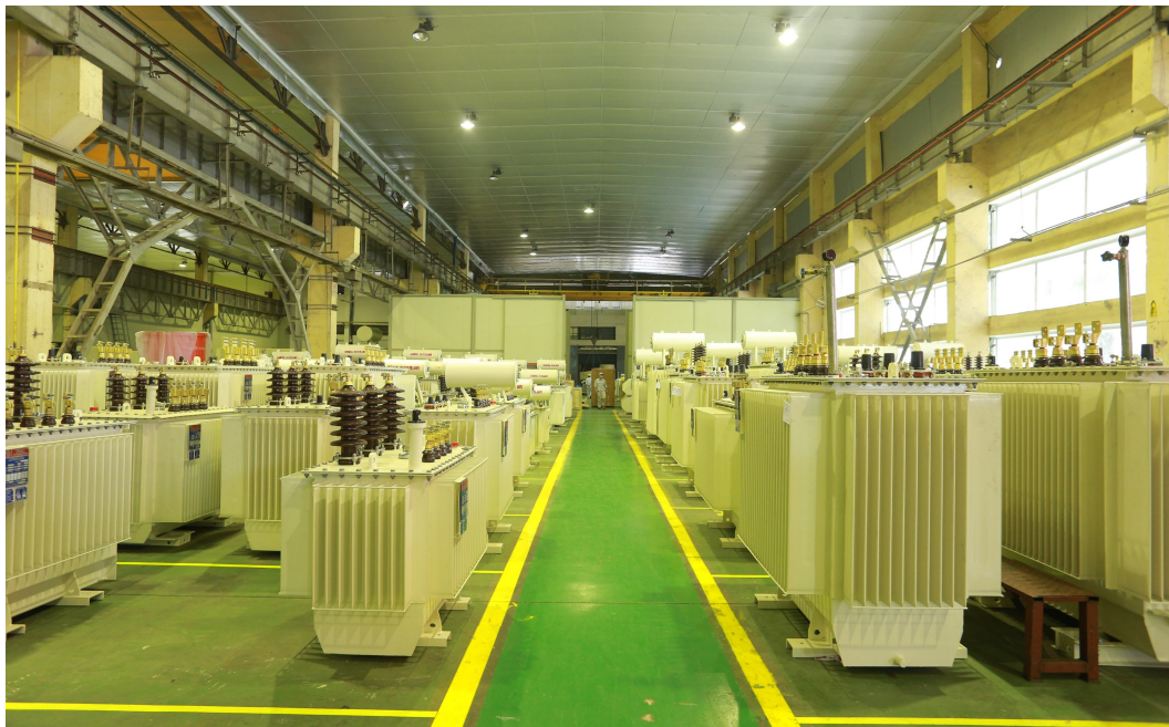
Sản phẩm Máy biến áp phân phối của Tổng Công ty