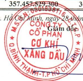
Đoàn Đắc Học