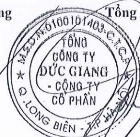
Phạm Tiến Lâm

(Các thuyết minh từ trang 10 đến trang 41 là bộ phận hợp thành của Báo cáo tài chính này.)