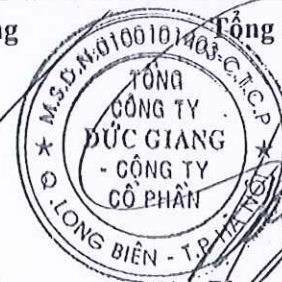
Phạm Tiến Lâm

(Các thuyết minh từ trang 10 đến trang 41 là bộ phận hợp thành của Báo cáo tài chính này.)