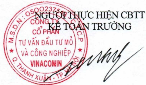
Phùng Đức Trường