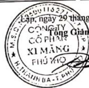
Trần Tuấn Đạt