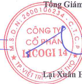
Lại Xuân Hùng