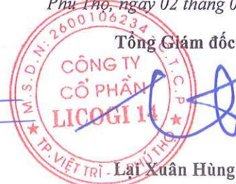
Lại Xuân Hùng