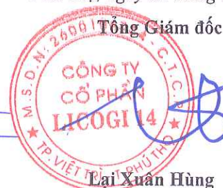
Lại Xuân Hùng