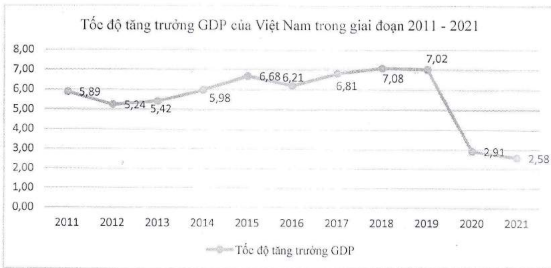
Hình 1: Tốc độ tăng trưởng GDP của Việt Nam trong giai đoạn 2011 – 2021 (%)

Năm 2021 tiếp tục là một năm khó khăn đối với nền kinh tế thế giới nói chung và Việt Nam nói riêng khi dịch bệnh Covid-19 có những diễn biến phức tạp và xuất hiện nhiều biến chủng mới. Trong bối cảnh đó, theo Tổng cục Thống kê, tính chung năm 2021, GDP của Việt Nam tăng 2,58% (quý I tăng 4,72%; quý II tăng 6,73%; quý III giảm 6,02%; quý IV tăng 5,22%) so với năm trước do dịch Covid-19 ảnh hưởng nghiêm trọng tới mọi lĩnh vực của nền kinh tế, đặc biệt là trong quý III/2021 nhiều địa phương kinh tế trọng điểm phải thực hiện giãn cách xã hội kéo dài để phòng chống dịch bệnh. Riêng trong quý IV/2021, tuy mức độ tăng trưởng GDP 5,22% cao hơn quý IV/2020 là 4,61% nhưng thấp hơn tốc độ tăng trưởng quý IV các năm từ 2011 – 2019. Đặc biệt, mức tăng 2,58% của năm 2021 thấp hơn mức tăng 2,91% của năm 2020.