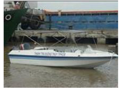
Cano Composite cao tốc