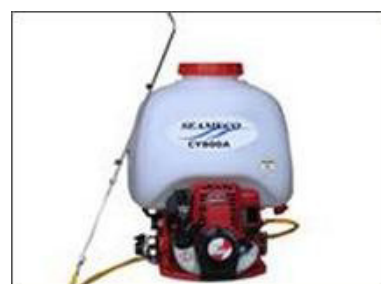
Máy phun thuốc