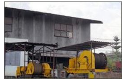
Dịch vụ lên xuống xà lan