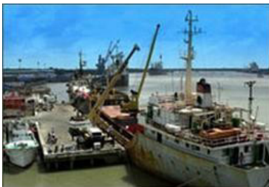
Dịch vụ cầu cảng