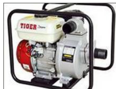
Máy xăng Máy cắt cỏ Máy bơm nước