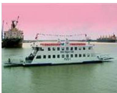
Tàu du lịch, tàu khách