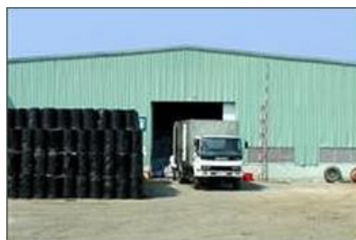
Dịch vụ kho bãi