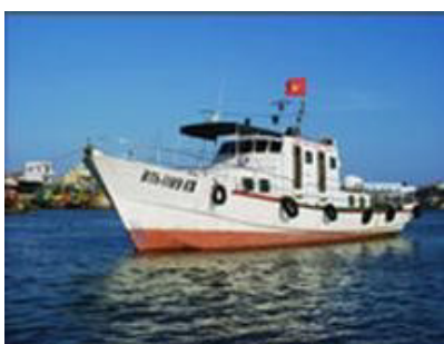
Tàu tuần tra, kiểm ngư