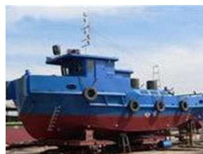
Tàu vỏ thép