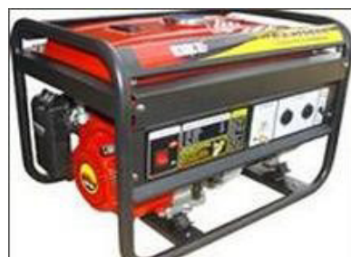
Máy phát điện