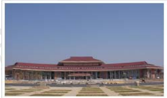
Trung tâm văn hóa Kinh Bắc