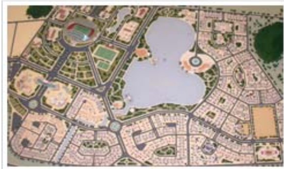
Mô hình Khu đô thị