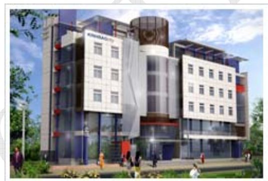
Văn phòng Công ty từ năm 2008