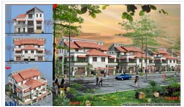
Các mẫu biệt thự trong khu đô thị Phúc Ninh