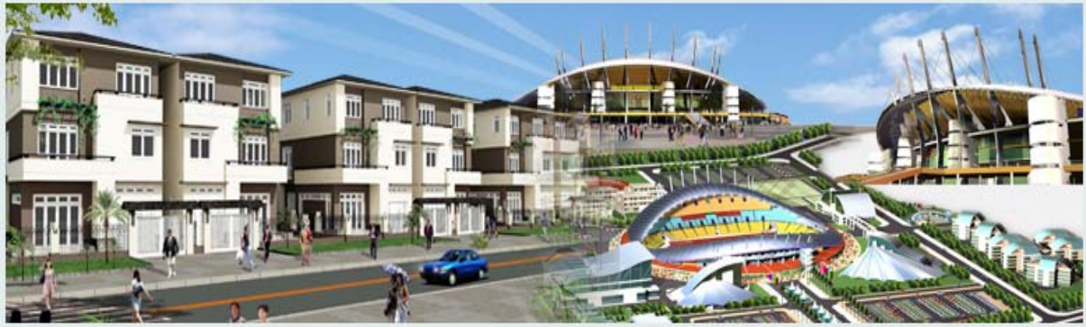
Phối cảnh trung tâm khu đô thị Phúc Ninh