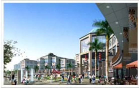
Phối cảnh Trung tâm Thương mại