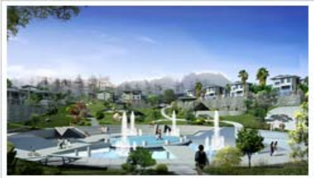
Một góc phối cảnh công viên