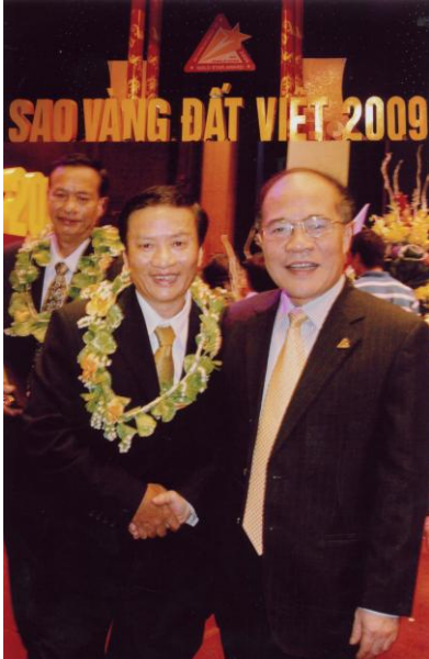
Phó Thủ tướng thường trực Chính phủ Nguyễn Sinh Hùng chúc mừng PITCO nhận Giải thưởng Sao vàng Đất Việt năm 2009 (TOP 100)