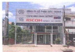
Binh Duong Branch