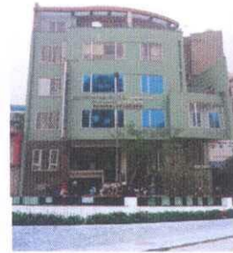
Ha Noi Branch