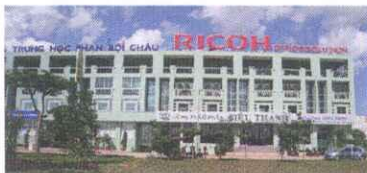
Head Office - Ho Chi Minh