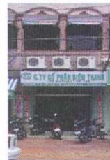
Vung Tau Branch