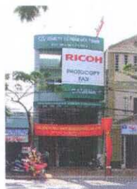
Can Tho Branch