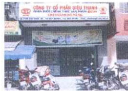
Da Nang Branch