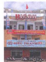
Dong Nai Branch