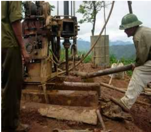
Quá trình thăm dò