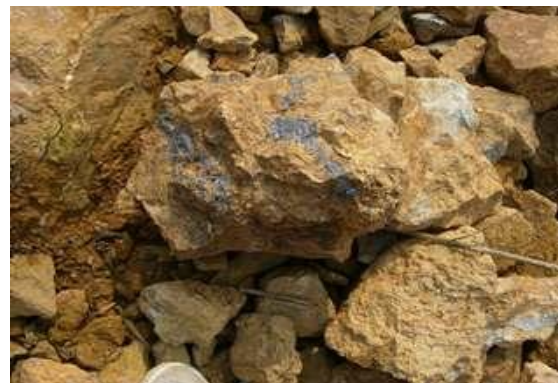
Quặng Nguyên khai kẽm