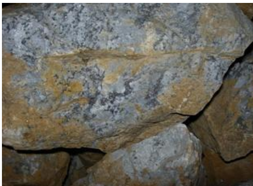
Quặng Nguyên khai Chì

Hình ảnh sản phẩm chính của Công ty như sau: