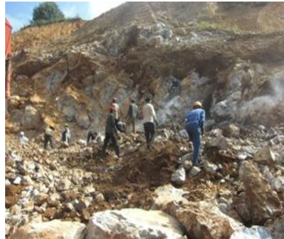
Quá trình khai thác