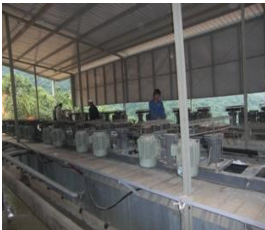
Quá trình chế biến