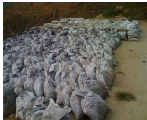
Sản phẩm tinh quặng chì xuất khẩu