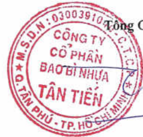
Đoàn Thu Nhận