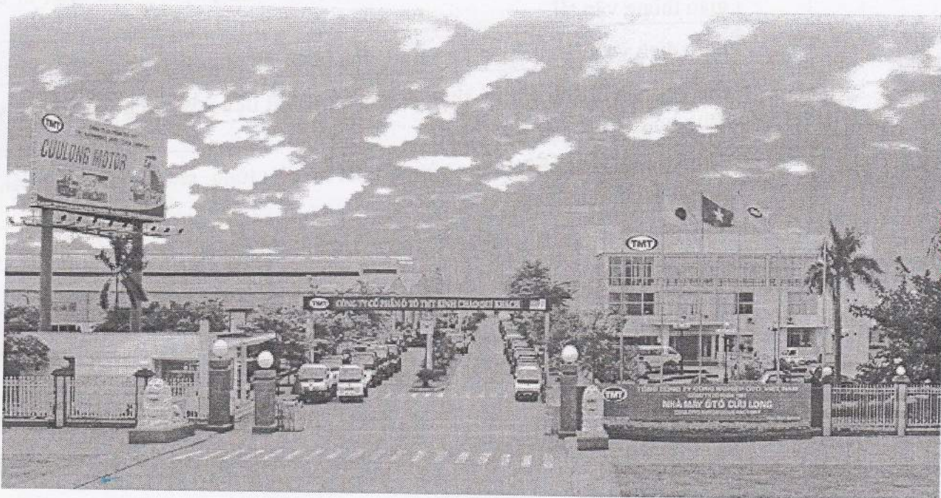
Quang cảnh Nhà máy ô tô Cửu Long - CUU LONG AUTOMOBILE FACTORY