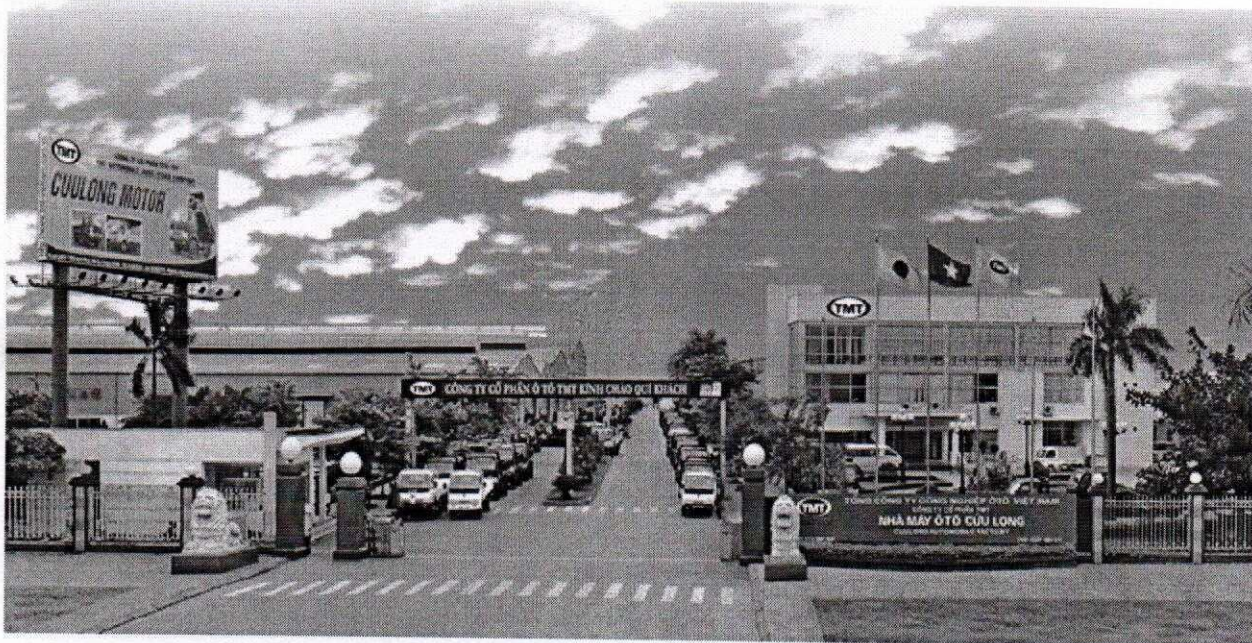
Quang cảnh Nhà máy ô tô Cửu Long - CUU LONG AUTOMOBILE FACTORY