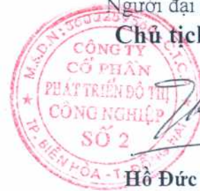
Hồ Đức Thành