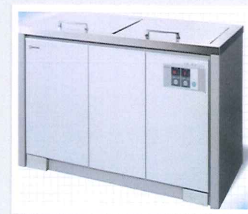
Bồn rửa siêu âm, Sakura