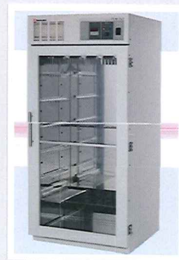
Máy sấy ống y tế, Sakura