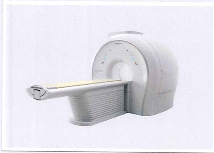
Hệ thống cộng hưởng từ, Hitachi