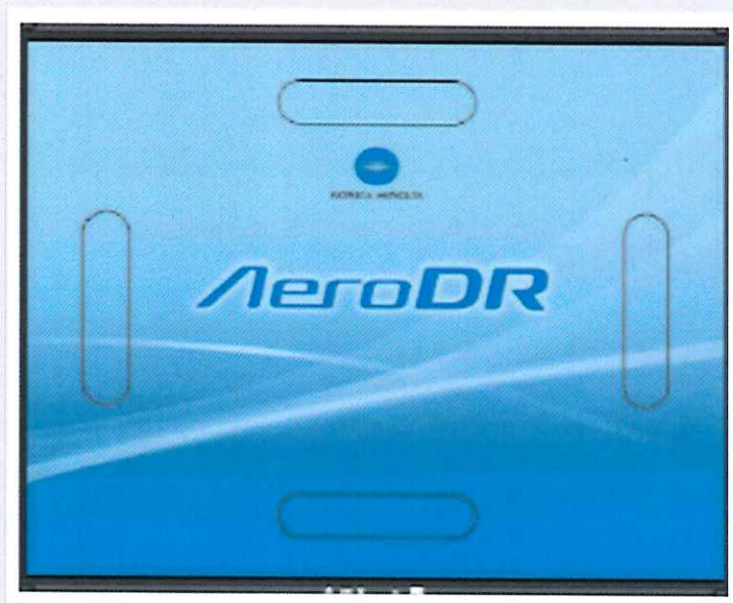
Hệ thống DR, Konica