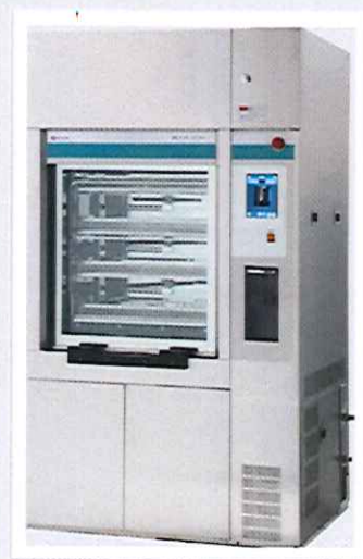
Máy rửa khử khuẩn: 1 cửa và 2 cửa, Sakura