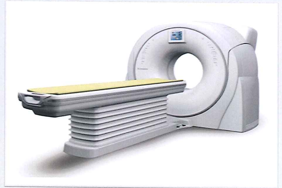
Hệ thống chụp cắt lớp, Hitachi