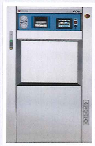
Máy tiệt trùng hơi nước: 1 cửa và 2 cửa, Sakura