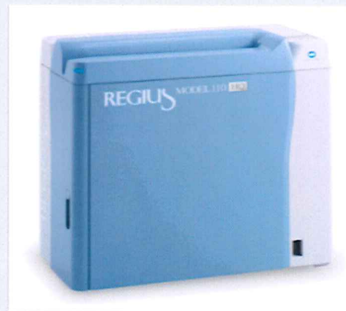
Hệ thống CR, Fujifilm