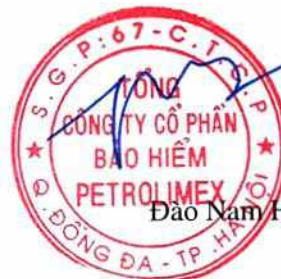
Đào Nam Hải

Các thuyết minh đính kèm là bộ phận hợp thành của báo cáo tài chính hợp nhất này