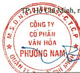
Đặng Bá Tùng Chủ tịch Hội đồng quản trị