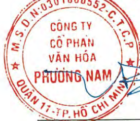
Đặng Bá Tùng Chủ tịch Hội đồng quản trị