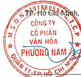
Đặng Bá Tùng Chủ tịch Hội đồng quản trị