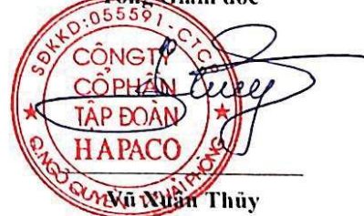
Khu Xuân Thủy