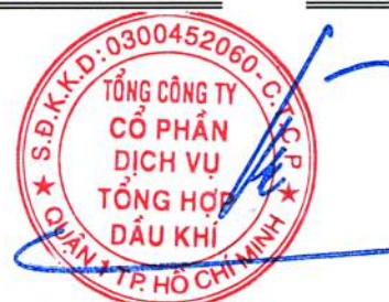
Phùng Tuấn Hà Chủ tịch HĐQT Ngày 31 tháng 3 năm 2021

Các thuyết minh từ trang 10 đến trang 62 là một phần cấu thành báo cáo tài chính hợp nhất này.