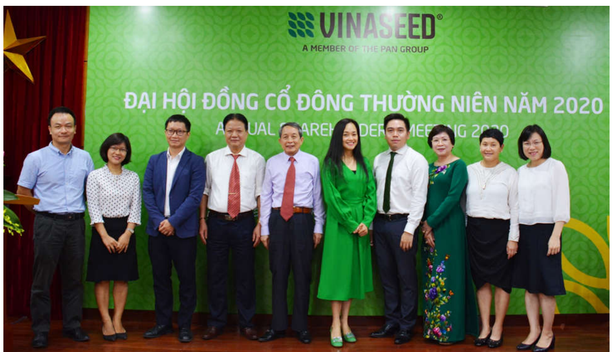
Ảnh: HĐQT, BKS chụp ảnh lưu niệm cùng lãnh đạo Tập đoàn PAN

Năm 2020, Đại hội cổ đông hoạch định mục tiêu kinh doanh của Tập đoàn với doanh thu: 1.530 tỷ đồng, lợi nhuận: 185,1 tỷ đồng, duy trì mức chi trả cổ tức bằng tiền cao từ 30% - 40%. Tập trung đầu tư chiều sâu cho công tác phát triển sản phẩm mới thích ứng với bối cảnh biến đổi khí hậu phức tạp như hiện nay. Tiếp tục thực hiện tái cấu trúc Tập đoàn và các công ty thành viên, kiện toàn và đổi mới mô hình kinh doanh trên cơ sở hoạch định mục tiêu chiến lược 2021 – 2025. Tiếp tục hiện đại hóa, ứng dụng công nghệ số trong quản trị doanh nghiệp.