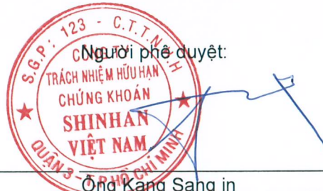
Ông Kang Sang in Thừa ủy quyền theo pháp luật