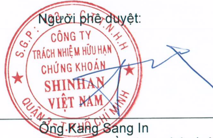
Ông Kang Sang In Thừa ủy quyền theo pháp luật