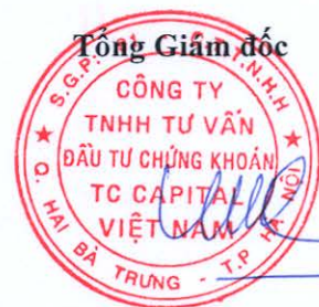
Đặng Quốc Hùng