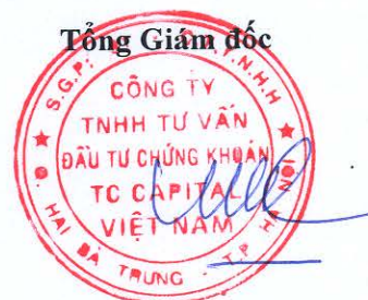
Đặng Quốc Hùng