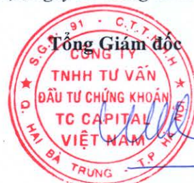
Đặng Quốc Hùng