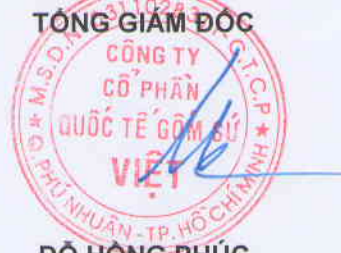
ĐỒ HỒNG PHÚC