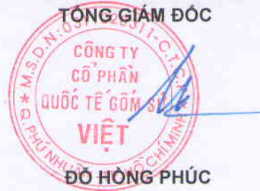
ĐỖ HỒNG PHÚC