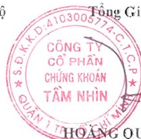
HOÀNG QUỐC HÙNG