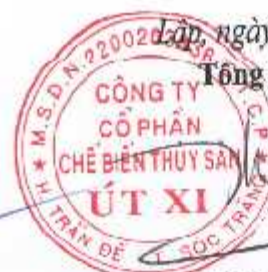
Đỗ Thành Nhơn