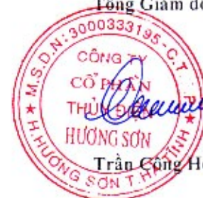
Trần Công Hộc