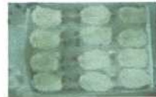
Coconut Breaded Butterfly