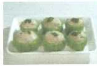
Shrimp Paste With Bitter Melon