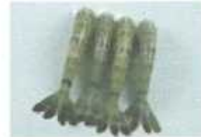
Raw HLSO EZ PEEL