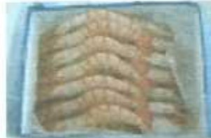
Cooked whole shrimp