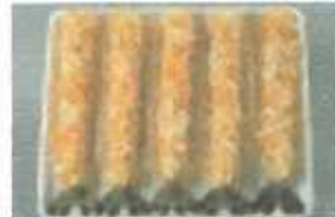
Breaded PTO Straight