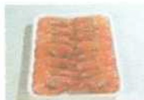
Cooked whole shrimp