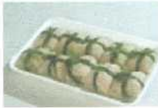
Shrimp Paste Covered With Cabbage