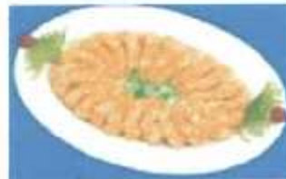
Breaded PD Color