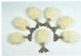
Breaded Butter Fly