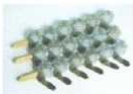
Double Piercing Pto Skewer