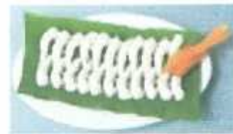
Breaded PD White