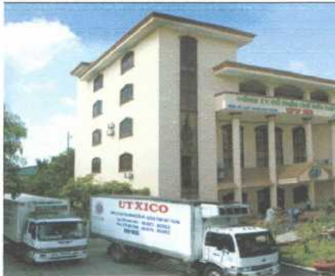
“Trụ sở chính công ty”