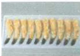
Breaded PTO Curve