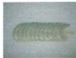
Single Piercing PD Skewer