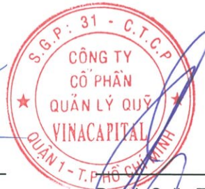
Brook Colin Taylor Người đại diện theo pháp luật Ngày 30 tháng 3 năm 2018

Các thuyết minh từ trang 17 đến trang 27 là một phần cấu thành của báo cáo này.