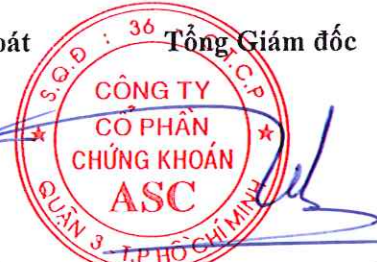
ĐẶNG QUANG TÝ