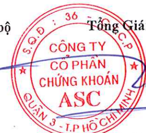
ĐẶNG QUANG TÝ