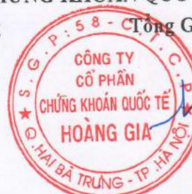
Trần Thị Thu Hương

(Các thuyết minh từ trang 13 đến trang 45 là bộ phận hợp thành của Báo cáo tài chính này)