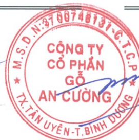
Trần Lương Thanh Tùng Thành viên Hội đồng Quản trị Ngày 26 tháng 3 năm 2021

Các thuyết minh từ trang 9 đến trang 42 là một phần cấu thành báo cáo tài chính riêng này.