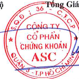
ĐẶNG QUANG TÝ