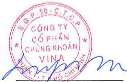
NA SUNGSOO Chủ tịch Hội đồng Quản trị