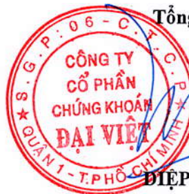
ĐIỆP TRÍ MINH