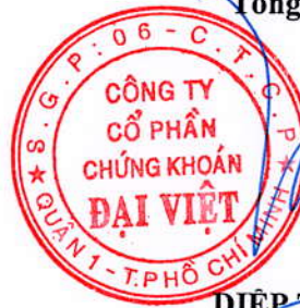
DIỆP TRÍ MINH