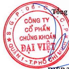
DIỆP TRÍ MINH