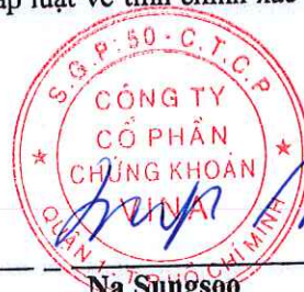
Na Sungsoo Chủ tịch Hội đồng quản trị