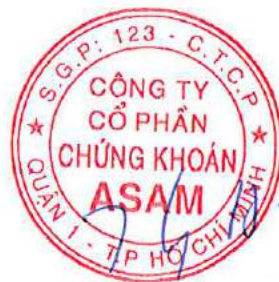
Chủ tịch Hội đồng Quản trị KIM HWAN KYOON