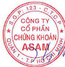
Chủ tịch Hội đồng Quản trị KIM HWAN KYOON