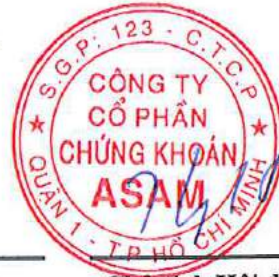
Chủ tịch Hội đồng Quản trị KIM HWAN KYOON