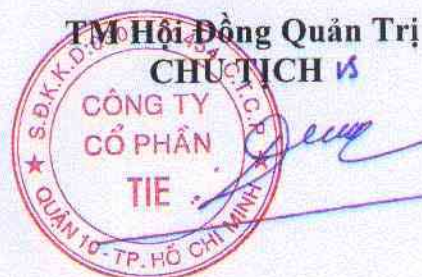
VŨ ĐỨC DŨNG