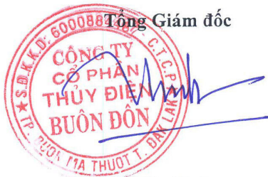
An Văn Sinh Đắk Lắk, ngày 27 tháng 03 năm 2016