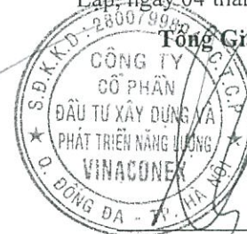
Phạm Bảo Long

1 2 3 4 5 6 7 8 9 10 11 12 13 14 15 16 17 18 19 20 21 22 23 24 25 26 27 28 29 30 31 32 33 34 35 36 37 38 39 40 41 42 43 44 45 46 47 48 49 50 51 52 53 54 55 56 57 58 59 60 61 62 63 64 65 66 67 68 69 70 71 72 73 74 75 76 77 78 79 80 81 82 83 84 85 86 87 88 89 90 91 92 93 94 95 96 97 98 99 100